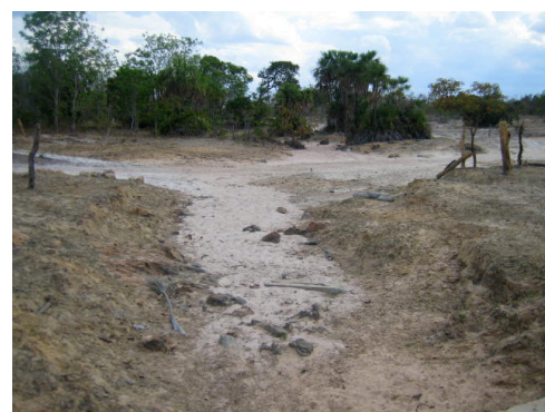
Verortung ausgetrockneter Wasserläufe