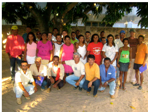
Kurs-Abschluß für Kleinbauern-VertreterInnen

Im Jahr 2004 wurde die Entwicklungs-Agentur 10envolvimento gegründet. Sie wird vom unabhängigen Verein ADES getragen. Sein Grund-Anliegen formuliert er so: