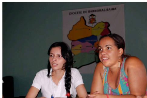
Jugendliche artikulieren ihre Vorstellungen zu Jugendpolitik