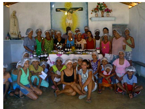
Herstellung von Naturheilmitteln